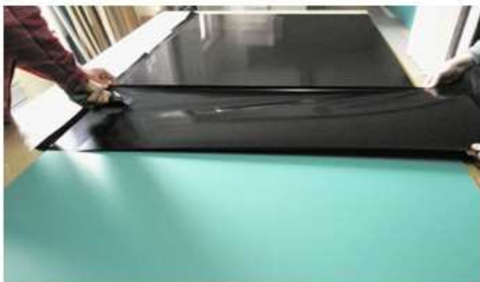
POTAŽENÍ ZRCADLA BEZPEČNOSTNÍ FOLIÍ