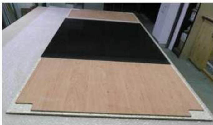
SESTAVENÍ DĚLENÝCH DVEŘÍ