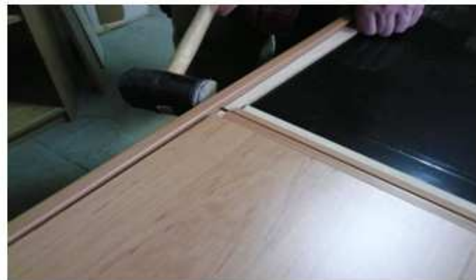
NASAZENÍ SVISLÉ LIŠŤY