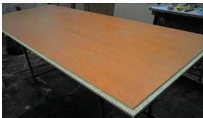
FRÉZOVÁNÍ LAMINA 18 mm