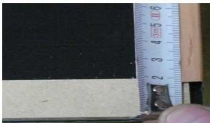
VODOROVNÁ LIŠŤA 18 mm OD OKRAJE