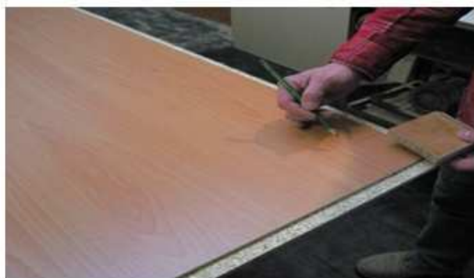
NÁKRES NA KAPSU