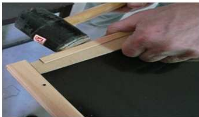
NASAZENÍ VODOROVNÉ LIŠTY