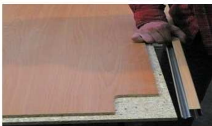
NASAZENÍ SVISLÉ LIŠTY