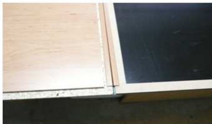
NASAZENÍ VODOROVNÝCH LIŠŤ