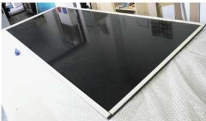
PŘIPRAVENÉ ZRCADLO PRO OLIŠTOVÁNÍ